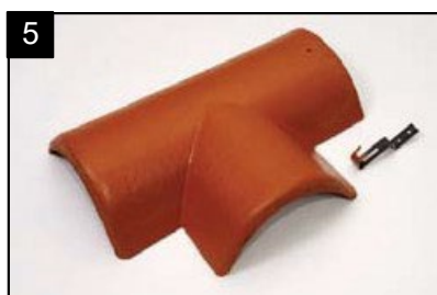
SET rozdělovací hřebenáč pravý T 250 s jednou přichytkou Pro kolmé napojení dvou hřebenů v jedné rovině.