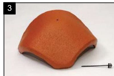
SET rozdělovací hřebenáč s jedním vrutem Pro napojení hřebene a dvou nároží.