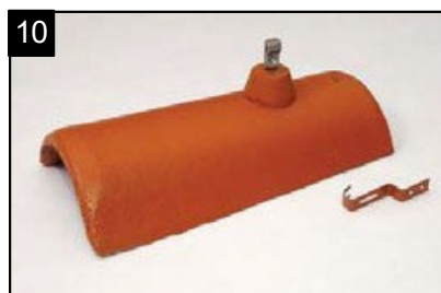
SET Hromosvodový hřebenáč s jednou přichytkou Pro upevnění vodiče hromosvodu na hřebeni a nároží.