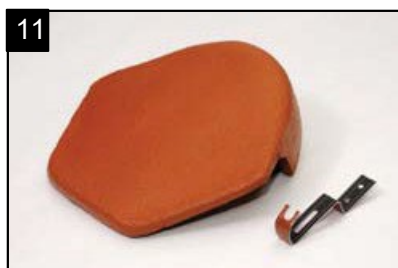
SET uzávěra hřebene s jedním vrutem a s jednou přichytkou Pro zakončení hřebene sedlových střech