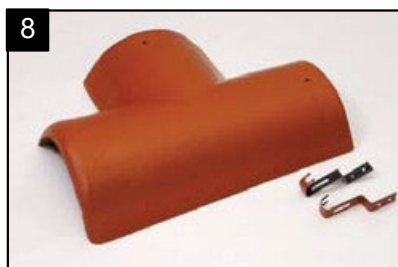
SET rozdělovací hřebenáč levý T 220 se dvěma přichytkami Pro kolmé napojení dvou hřebenů v jedné rovině.