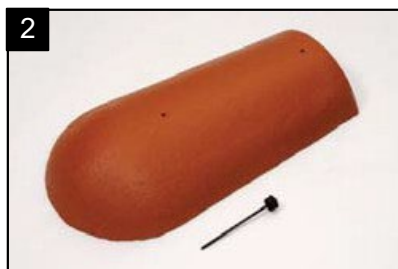
SET koncový hřebenáč s jedním vrutem Pro spodní zakončení nároží.