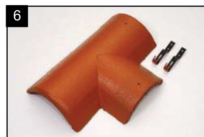
SET rozdělovací hřebenáč pravý T 220 se dvěma přichytkami Pro kolmé napojení dvou hřebenů v jedné rovině.