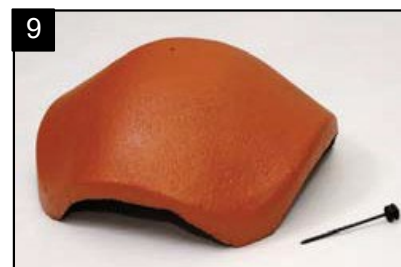
SET rozdělovací hřebenáč XS s jedním vrutem Pro napojení čtyř nároží.