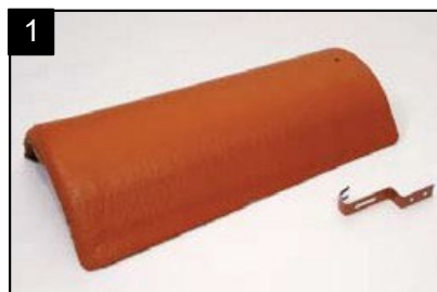
SET hřebenáč s jednou přichytkou Pro pokrývání hřebene a nároží.